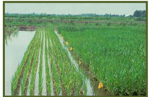
Kulang sa nitrogen