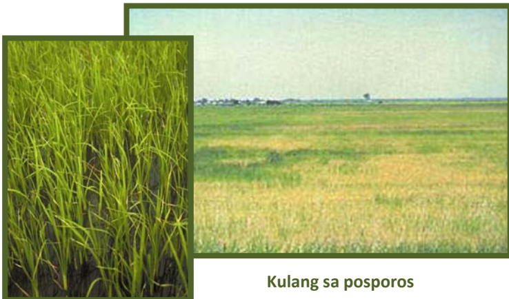
Kulang sa posporos