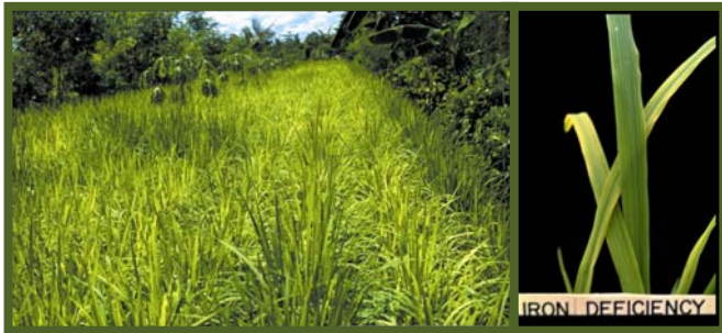
Kulang sa iron