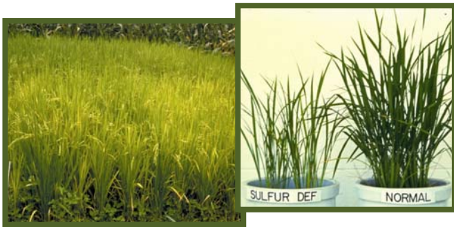
Kulang sa sulfur