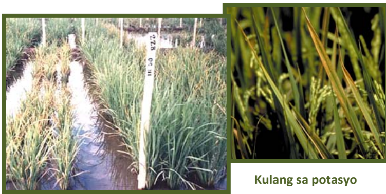
Kulang sa potasyo