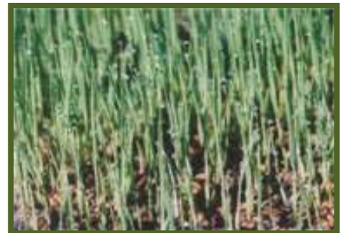
Bunubon a pangraep