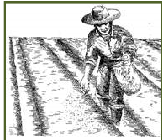
Panagiwaris ti bin-i iti pagbunubonan