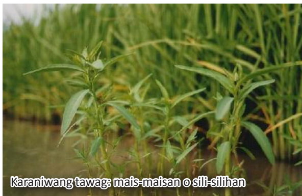
Karaniwang tawag: mais-maisan o sili-silihan