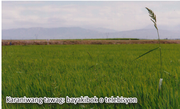
Karaniwang tawag: bayakibok o telebisyon