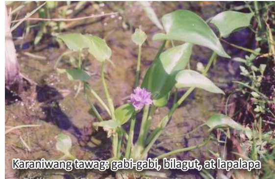
Karaniwang tawag: gabi-gabi, bilagut, at lapalapa