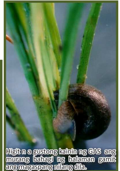
Higit na gustong kainin ng GAS ang murang bahagi ng halaman gamit ang magaspang nilang dila.