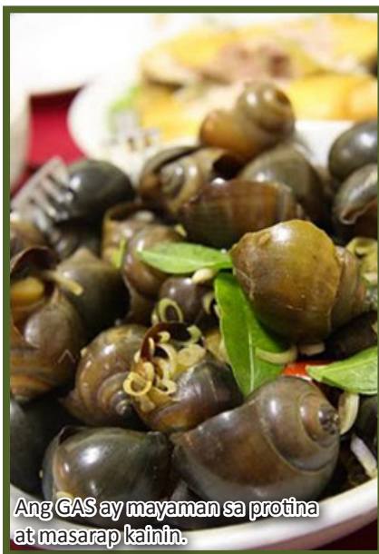
Ang GAS ay mayaman sa protina at masarap kainin.