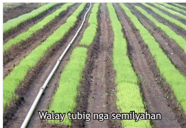
Walay tubig nga semilyahan