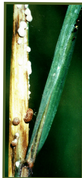
Sa mga batik ay nabubuo ang mga bahaging nakakalalin na tinatawag na sclerotia.