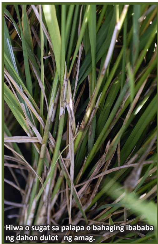
Hiwa o sugat sa palapa o bahaging ibababa ng dahon dulot ng amag.