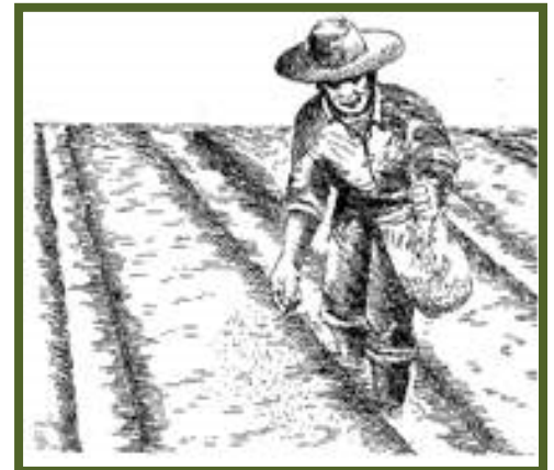
Pagsab-og sa mga binhi sa saboran