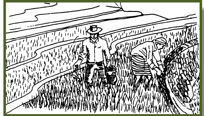
Agmula iti barayti a maitutop iti klima ti lugaryo. Kas koma iti Ifugao Rice Terraces, agmula iti barayti a maitutop para iti nangato ken nalamiis a lugar.

Pilien ti barayti a maiyannatup iti lugar nga adda irigasionna, agpannurray ti tudo, matiktikagan, maagadan, ken naresistencia iti peste nga agraraira iti lugaryo. Maammuan dagitoy nga impormasion manipud iti opisina iti agrikultura, seed growers , ken dadduma pay a mannalon iti lugaryo. Nadumaduma ti reaksion dagiti barayti iti peste, saksakit ken kasasaad ti aglawlaw. Kas iti PSB Rc44 ken PSB Rc46, napatator dagitoy para kadagiti lugar a nababa ti temperaturana kas dagiti bambantay ti Cordillera Administrative Region (CAR).