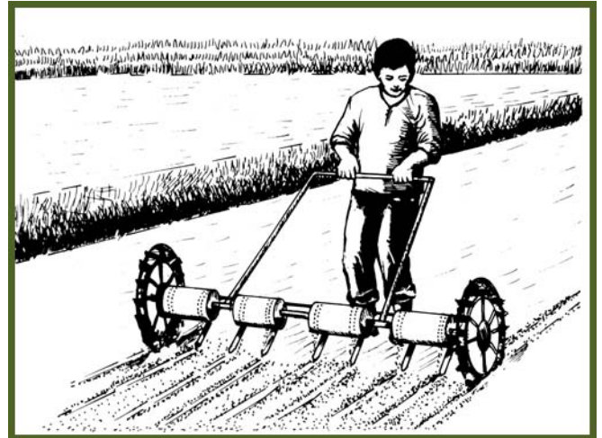
Direkta a panagmula babaen ti panagusar ti drum seeder