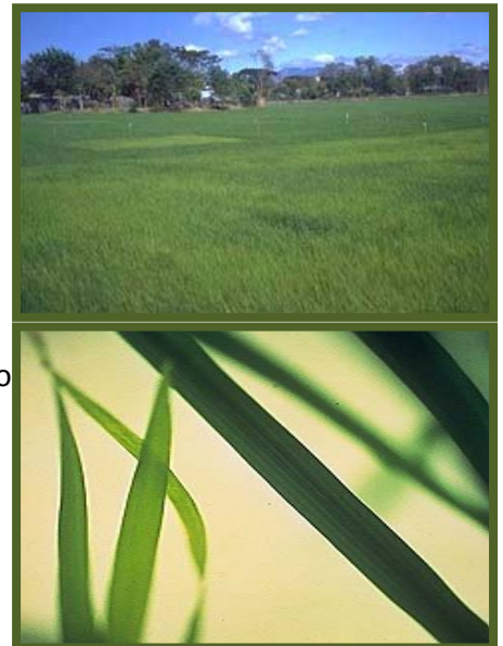
Mula nga agkururang ti nitroheno

Kadawyan nga agkururang ti Nitroheno dagiti mula a pagay. Napusyaw a berde dagiti nataengan wenno no dadduma amin a bulong ket agamarilio ti murdongda. Agamarilio ti intero a kapagayan. Agkururang iti Nitroheno ti pagay no madama daytoy nga aggipi ken agpalusot.