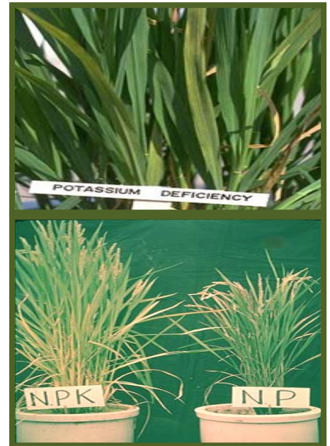
Mula nga agkurang iti potasium

Pandek ken narasay ti gipi dagiti pagay nga agkurang iti potasium. Ababa, leppay ken nalidem a berde dagiti akinngato a bulong, ken in-inut nga agbaliw ti kolor dagiti naub-ubing a bulong. Kapada iti sintomas ti tungro ti agamarilio a kolor kape a maris iti igid ti bulong. Kasla lati ti maris dagiti turik-turik a tumaud iti murdong dagiti daan a bulong a mangpagango kadagitoy.