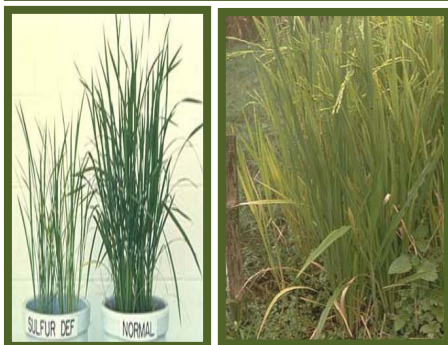
Mula nga agkurang iti sulfur

Dagiti dadduma pay a sintomas ket napusyaw a bunubon, adu ti matay a bunubon kalpasan a mairap, nabayag a panagdakkel, narasay ti gipi, basbassit ken ababa dagiti dawa, bassit a bilang dagiti binukel iti dawa, ken naladaw a matangkanan ti pagay.