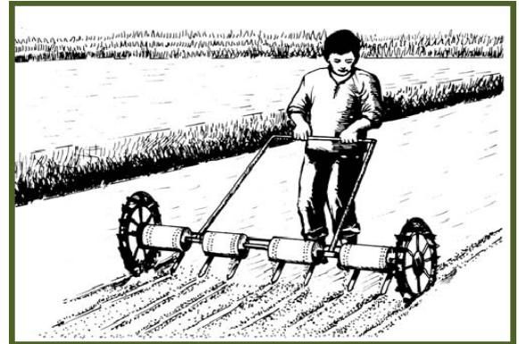
Sabwag-tanum gamit ang drum seeder