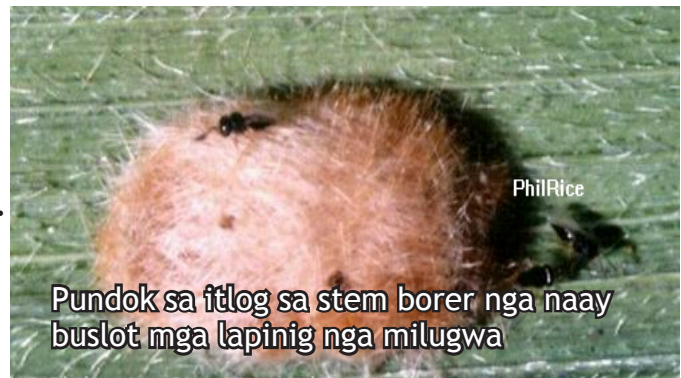
Pundok sa itlog sa stem borer nga naay buslot mga lapinig nga milugwa

Pagkaon: Itlog sa leaffolders, skippers, short-horned grasshoppers, armyworms, green semi-loopers, whorl maggots, stem borers, planthoppers, leafhoppers, black bugs, ug seed bugs.