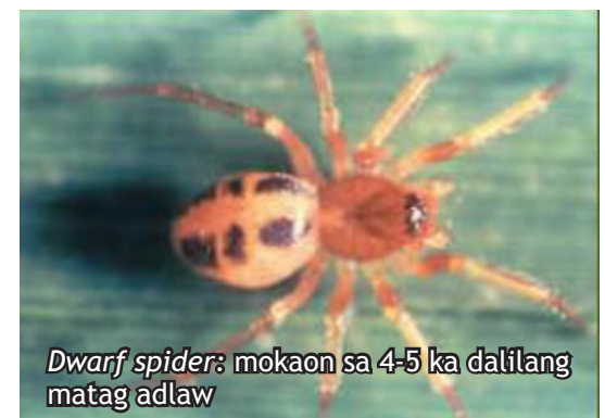
Dwarf spider: mokaon sa 4-5 ka dalilang matag adlaw

Pagkaon: dalilang sa planthoppers ug leafhoppers , whorl maggots , ug springtails