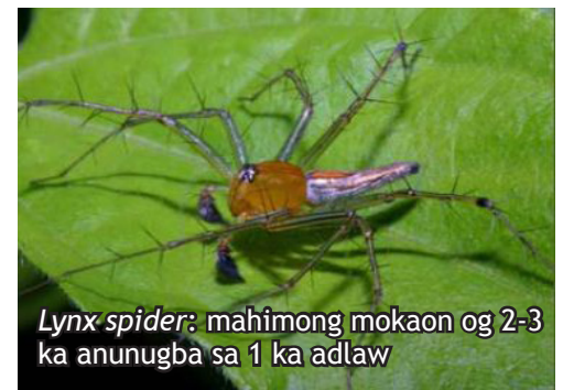
Lynx spider : mahimong mokaon og 2-3 ka anunugba sa 1 ka adlaw

Pagkaon: planthoppers , leafhoppers , caseworms , leaffolders , anunugba sa stemborer , rice seed bug , ug whorl maggots