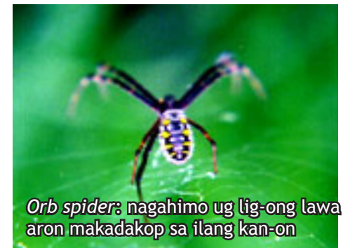
Orb spider: nagahimo ug lig-ong lawa aron makadapok sa ilang kan-on

Pagkaon: planthoppers , leafhoppers , caseworms , whorl maggots , dagkong stemborer , dagkong alibangbang, ug apan-apan