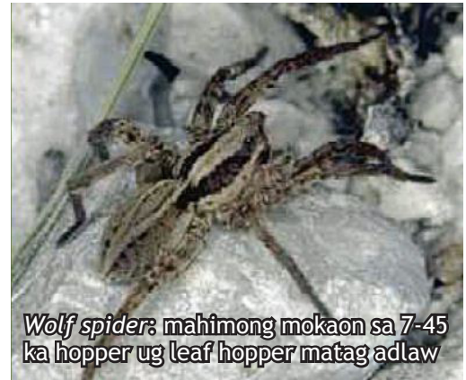
Wolf spider : mahimong mokaon sa 7-45 ka hopper ug leaf hopper matag adlaw

Pagkaon: planthoppers , leafhoppers , caseworms , leaffolders , whorl maggots , bag-ong pusa nga ulod, ug anunugba sa stemborers