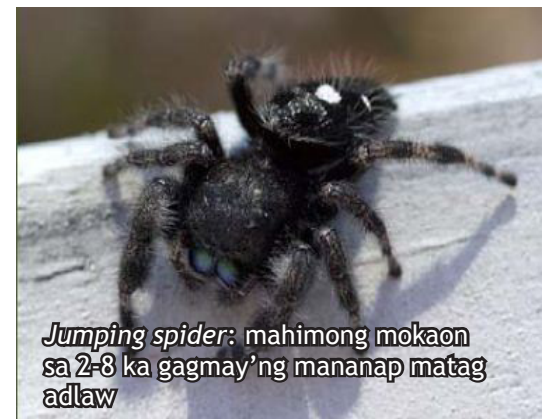
Jumping spider : mahimong mokaon sa 2-8 ka gagmay'ng mananap matag adlaw

Pagkaon: planthoppers , leafhoppers , dagkong langaw, ug uban pang gagmay'ng insekto