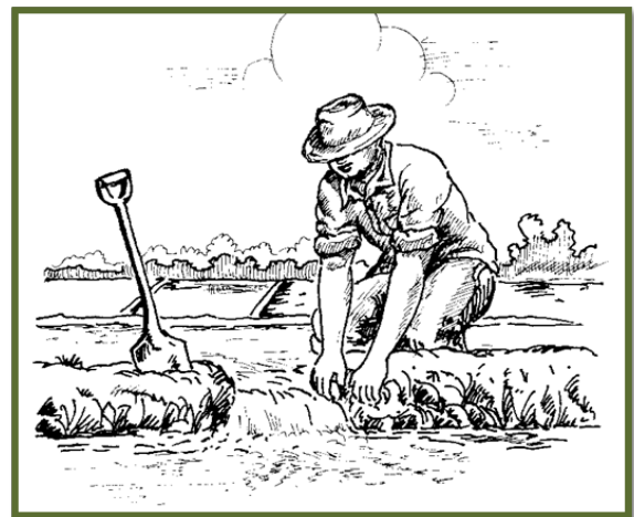
Pagbuhat ug gagmayng kanal pagkahuman sa pagpatag aron sa maayong pagdumala sa tubig

Ang sakto nga paglebel sa basakan makasolbad halos sobra sa 50% sa problema sa produksyon sa humay.