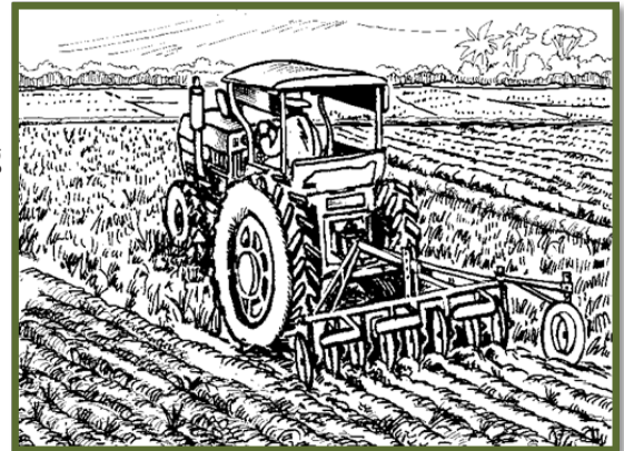
Ang traktora magamit sa pagdugmok sa mga tibuok nga yuta ug pagsagol sa mga organikong butang.

Duha ka adlaw adeser darohon pag-usab/ i-rotavate , patubigan ang basakan taman sa mabasa ug mahumok kini ug pasagdan nga ang binhi sa mga sagbot ug ang mga nahulog nga binhi sa humay para motubo.