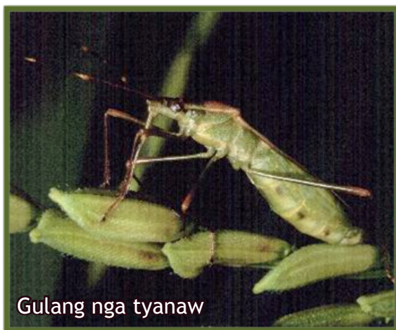
Gulang nga tyanaw

Ang atake sa insekto moresulta sa pag-usab sa color o magkaging ang lugas; walay baho ang hilaw ug luto nga bugas, ug walay lami nga mga dagami nga bisan ang mga baka dili ganahan mokaon.